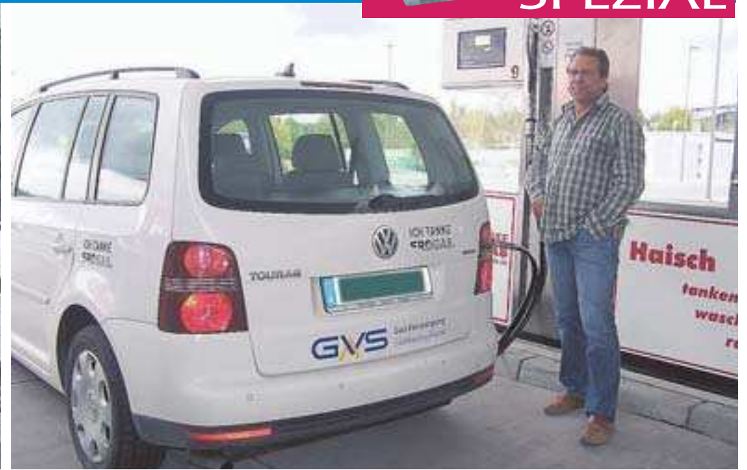
Der Kompressorraum und der Tankplatz der neuen und von den Stadtwerken VS installierten Erdgaszapfstelle am Messekreisel in der Dürrheimer Straße 57.