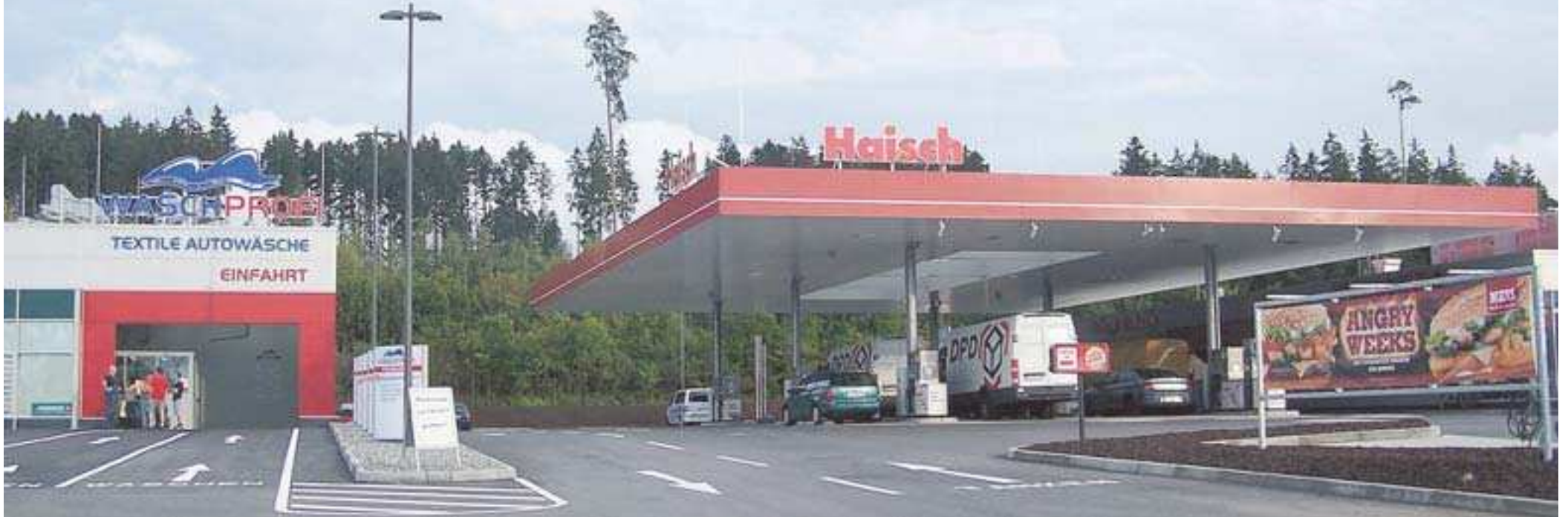
Die neue Tankstelle am Messekreisel gehört zur Haisch-Gruppe und zeigt dies auch deutlich an.

Heute Eröffnung mit Bewirtung und Programm / Tankstelle, Shop, Waschanlage und Burger-King