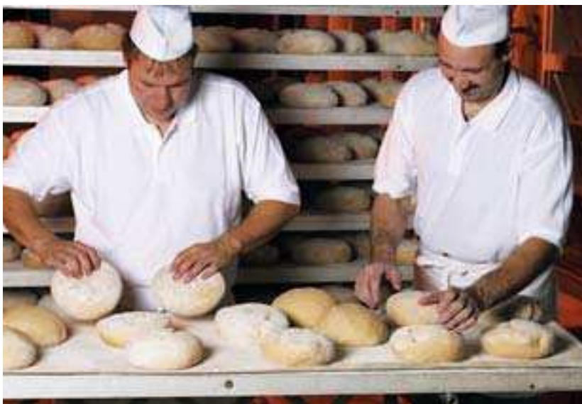
Auf Qualität wird in der Backstube bei Krachenfels gesetzt.