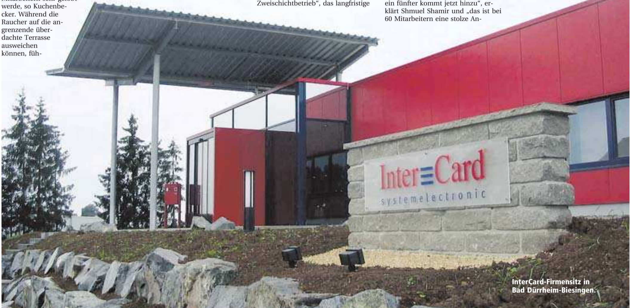
InterCard-Firmensitz in Bad Dürkheim-Biesingen.

InterCard Systemelectronic stellt keine eigenen Produkte her, sondern entwickelt Produkte bis hin zur Serienreife nach →