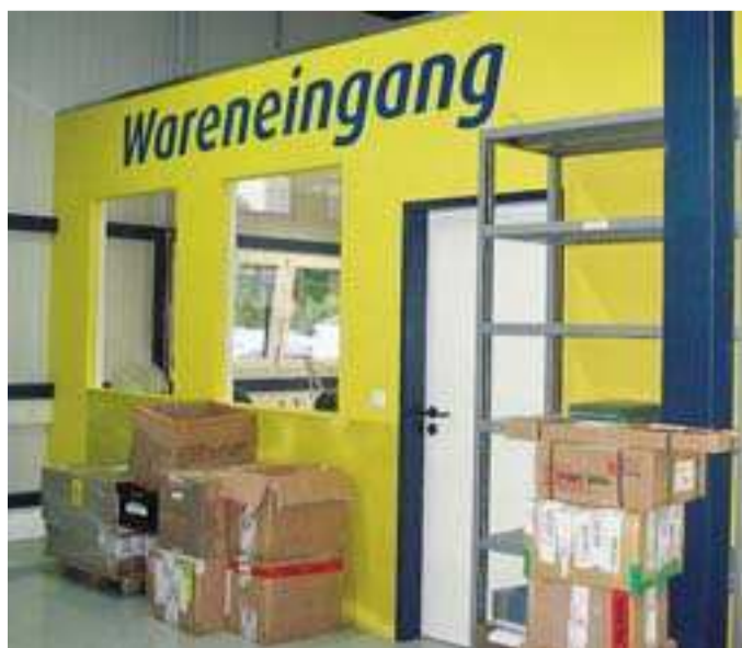
Der neugestaltete Eingang der Warenannahme zeichnet auch durch eine expressive Farbgestaltung aus.